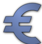
Ahorro de costes

TheGreeFa propone para la agricultura de invernadero tres soluciones innovadoras impulsadas por las energías renovables, que recuperan el calor latente y el agua de la humedad del aire .