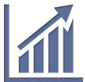
Aumento de la eficiencia energética

Hoy en día, la horticultura de invernadero está relacionada con la mayor productividad de todos los métodos comunes en la agricultura . El consumo de energía, especialmente para calefacción en Europa Central, sigue siendo elevado , mientras que, en el sur de Europa, el aumento de escasez de agua obligará a utilizar la desalación del agua de mar , lo que también puede provocar un salto cuántico en la demanda de energía .