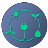
Gran uso de energía renovable